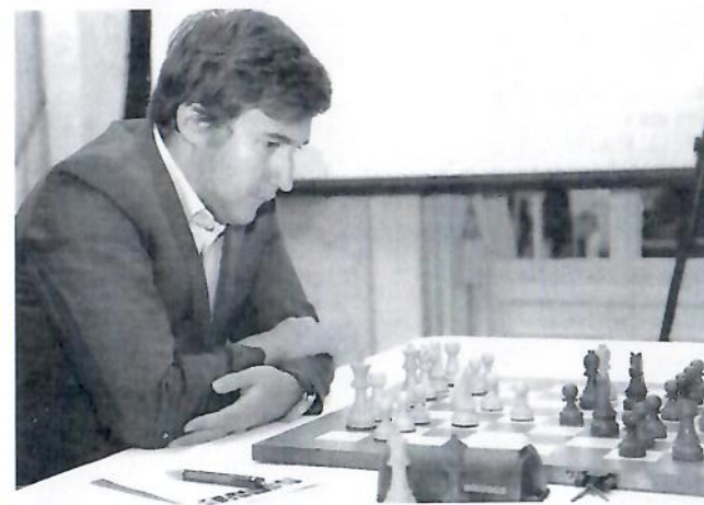
Sergey Karjakin: Quelle douche froide!

Une partie cruciale pour les médailles du championnat du Monde de parties rapides. Fedoseev, en tête, joue avec les Blancs contre Magnus Carlsen, qui revenait en force lors du dernier jour de